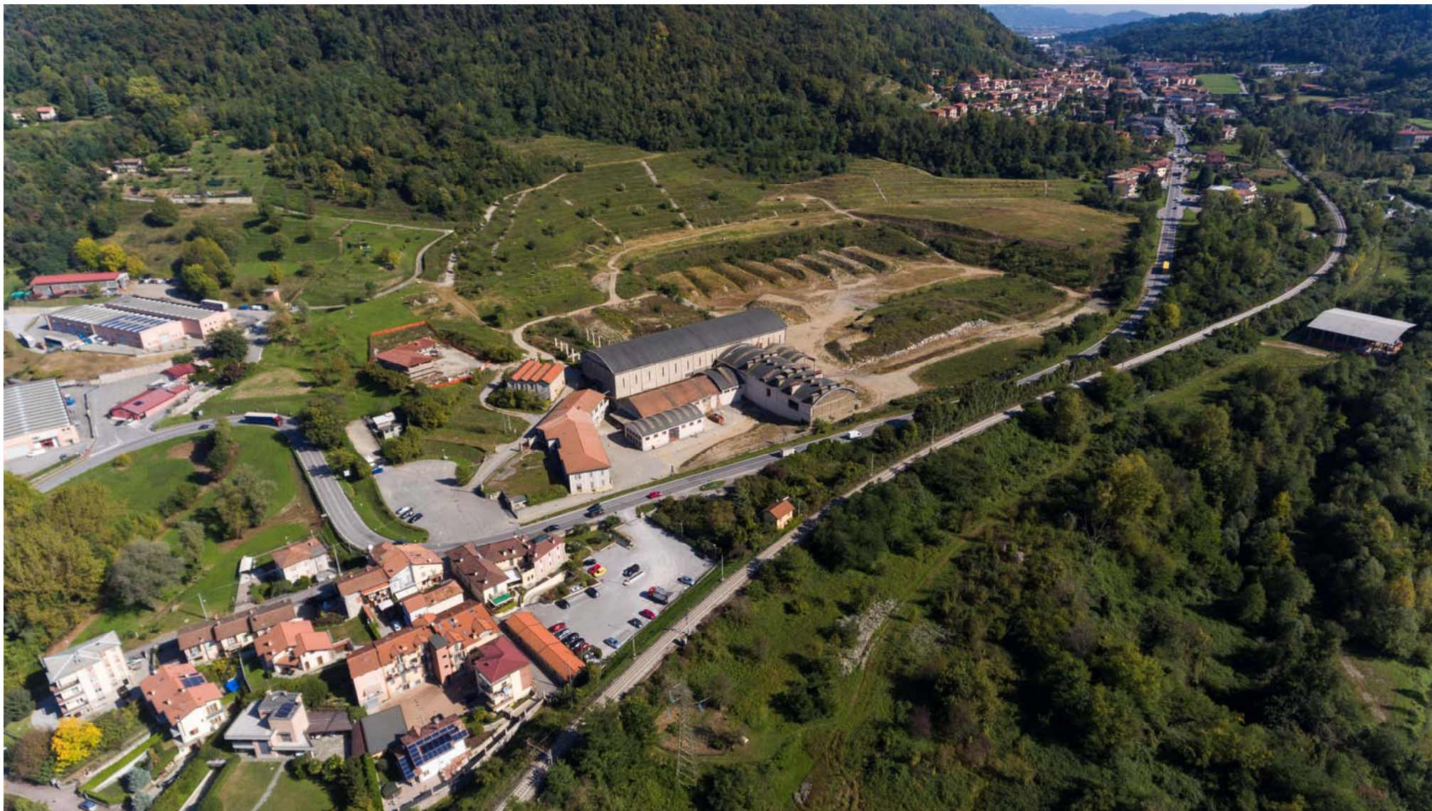
FOTOGRAFIA STATO DEI LUOGHI