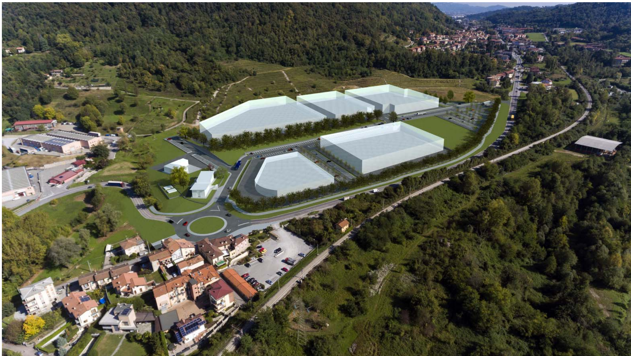
FOTOINSERIMENTO DEL PROGETTO