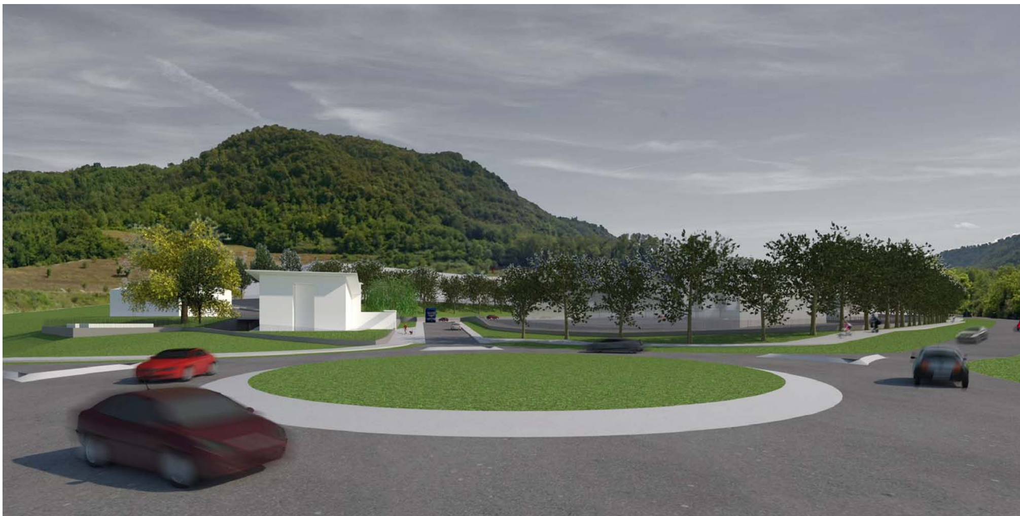
IMMAGINE N.3 (VISTA DALLA NUOVA ROTATORIA VERSO NUOVA STRADA INTERNA)