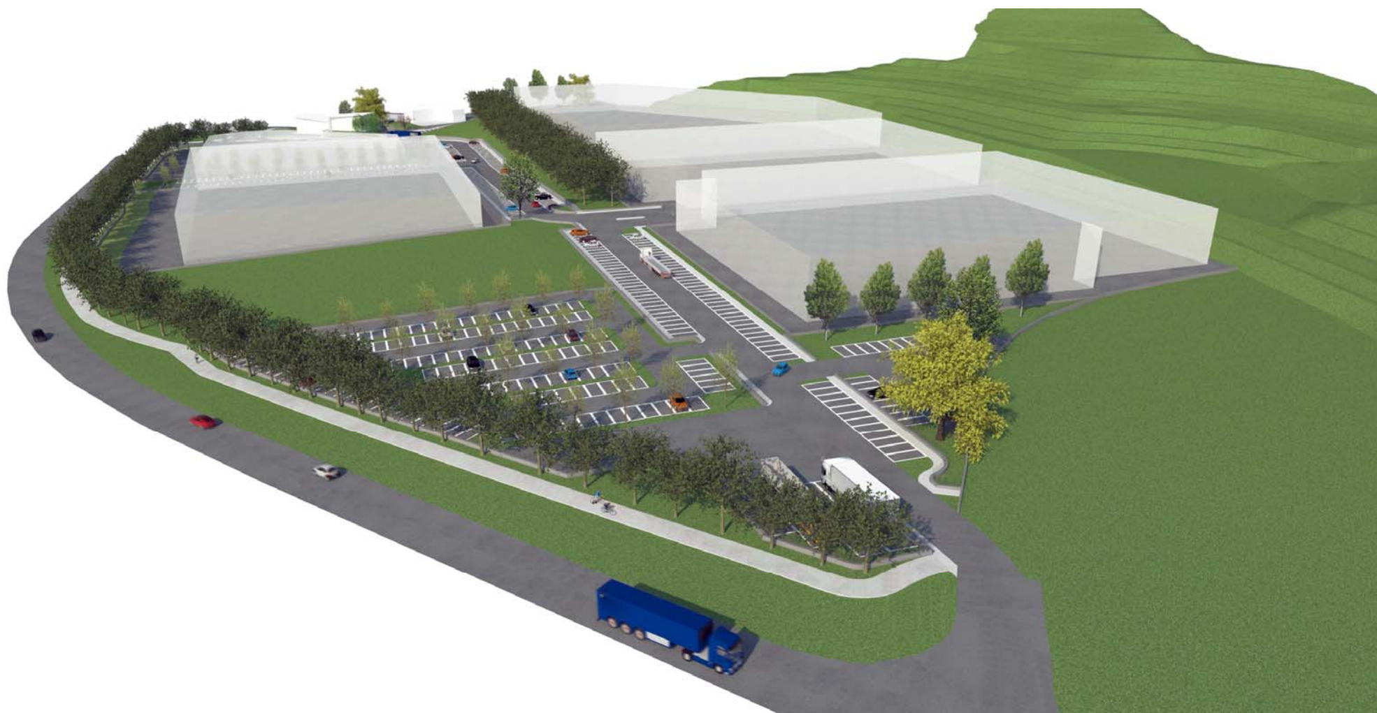
IMMAGINE N.1 (VISTA DA COMUNE DI PONTIDA)