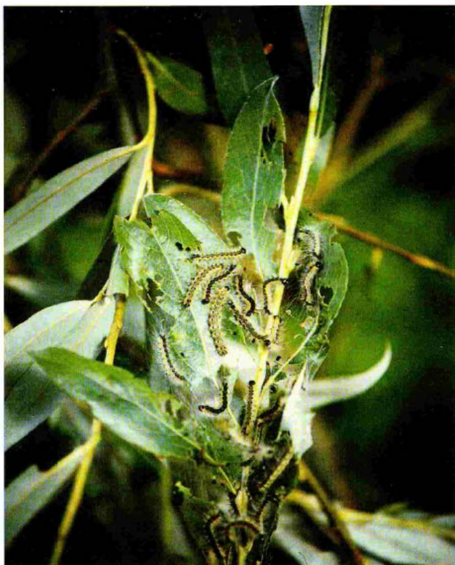
Larve di Hyphantria Cunea

le larve, estremamente polifaghe, provocano defogliazioni a carico di numerose specie, prediligono il gelso e l'acero negundo (che sono i primi ad essere attaccati). Noce, pioppo, platano, salice, tiglio, sambuco sono frequentemente colpiti e, nel caso di gravi infestazioni, anche ippocastano ed olmo, diverse specie di frutteti e di arbusti ornamentali possono essere danneggiati. Danni occasionali e solitamente contenuti si possono inoltre verificare sul finire dell'estate, a carico di coltivi di erba medica, mais e soia, attigui ad alberate intensamente defogliate.