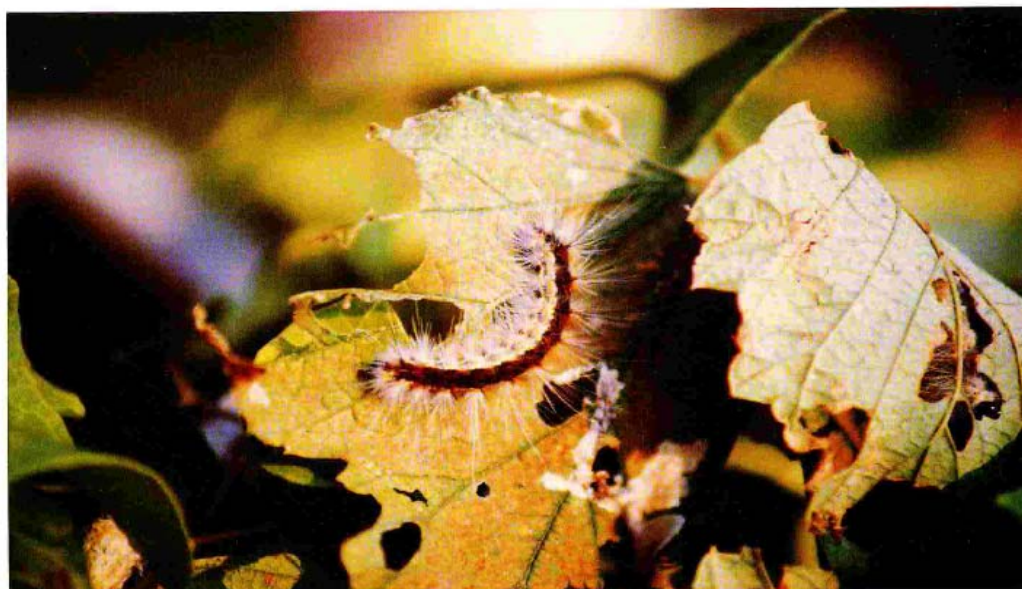
Larva di Hyphantria Cunea

Al centro - sud o nelle isole, si potrebbe anche giungere a tre generazioni l'anno.