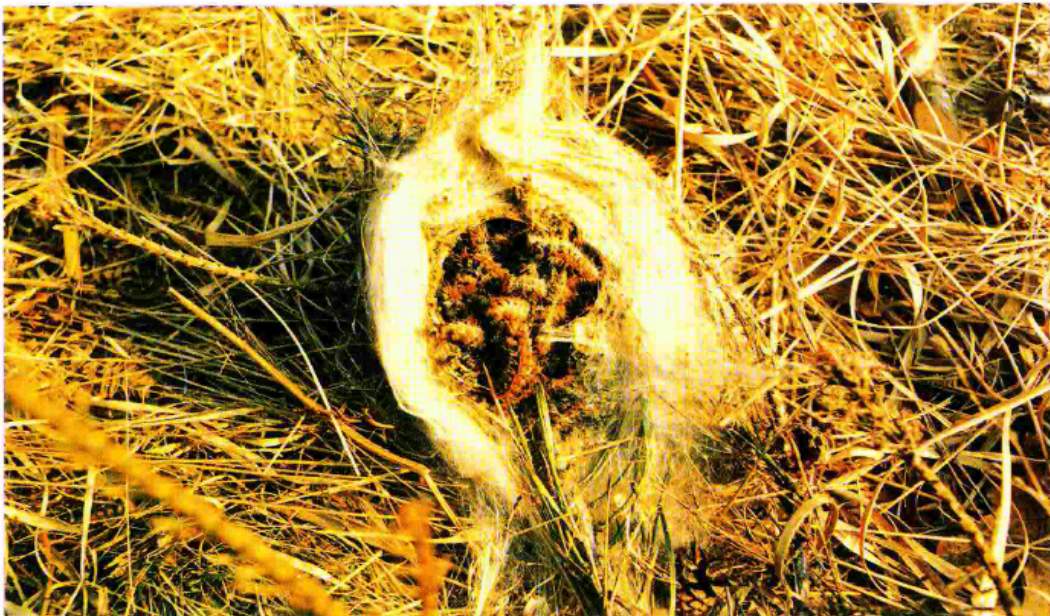
Nido aperto colmo di larve di processionaria del pino.

La processionaria è un insetto appartenente all'ordine dei Lepidotteri, le comuni farfalle. Durante gli stadi larvali (bruchi) le processionarie sono fitofaghe; si alimentano cioè delle parti verdi delle piante, provocando defogliazioni, indebolimento e blocco dell'accrescimento. Il riconosciuto potere molesto delle larve è dovuto alla presenza su di esse di numerosissimi peli urticanti che possono causare irritazioni e allergie cutanee all'uomo. Le popolazioni di processionaria sono soggette ad ampie fluttazioni cicliche, per cui si succedono periodi con sporadiche e modeste apparizioni a periodi con massicce infestazioni. Ciò avviene ogni 8 - 10 anni. Ci sono due specie di processionaria nella nostra penisola: la processionaria del pino ( Thaumetopoea pityocampa ) e la processionaria della quercia ( Thaumetopoea processionea ). Queste hanno un ciclo biologico diverso e in conseguenza di ciò i trattamenti, che devono essere effettuati sulle larve giovani, cadono per la processionaria del pino in agosto - settembre e per la processionaria della quercia in marzo - aprile.