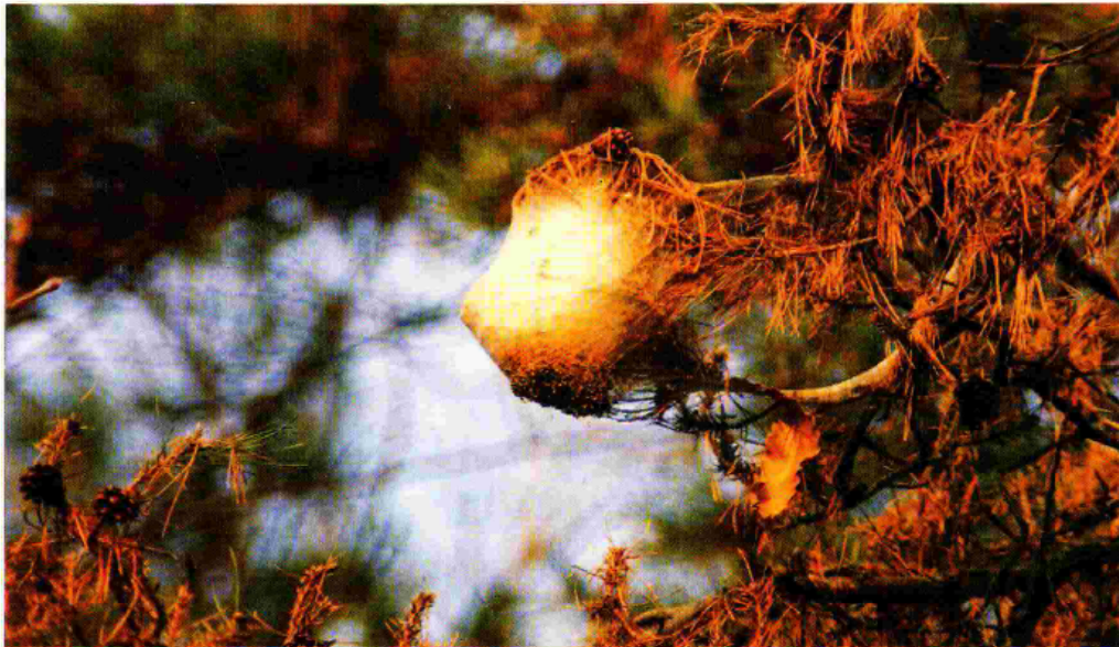
Nido di Thaumetopoea pityocampa.

In entrambi i casi lo scopo sarà quello di realizzare un ambiente sfavorevole ed inidoneo alla vita della processionaria durante il suo ciclo di sviluppo.