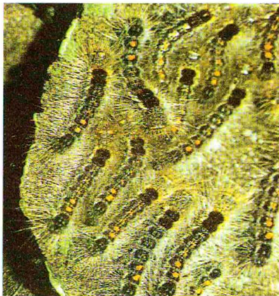
Giovani larve di E. Chrysorrhoea

Danni: le larve nascono e divengono attive nel pieno dell'estate, dalla fine di luglio alla metà di agosto. Hanno colore bruno nerastro, sono dotate di setole biancobruno (dalle proprietà urticanti) e sul dorso sono provviste di tubercoli color arancio. Ai lati del corpo si notano delle striature longitudinali bianco - arancio. Le larve manifestano tendenze gregarie. Le foglie delle piante ospiti (quercia, tiglio, acero, pioppo, carpino, rosacee e fruttifere varie) vengono ridotte alla sola nervatura. L'attacco determina dunque diffuse defogliazioni delle specie vegetali attaccate, che subiscono indebolimento e predisposizione ad altre malattie. Le modalità di lotta sono analoghe a quelle per Hyphantria Cunea .