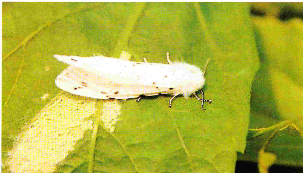
Adulto femmina di Hyphantria C. durante l'ovodeposizione.

I bruchi, raggiunta la maturità (in un mese circa) si mettono alla ricerca di adatti ricoveri: nel terreno, in un anfratto di tronco d'albero, in crepe nei muri, sotto le tegole delle abitazioni, per incrisalidarsi e svernare (larve della II generazione).